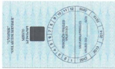
Format: 110 × 65 mm, Tisak: plava i crna